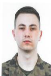
RYSUNEK 2 (FRYZURA - PRZYKŁAD)