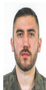
RYSUNEK 6 (ZAROST - PRZYKŁAD)