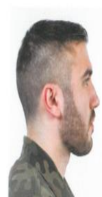
RYSUNEK 7 (ZAROST - PRZYKŁAD)